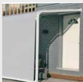
Stativ och frontdel