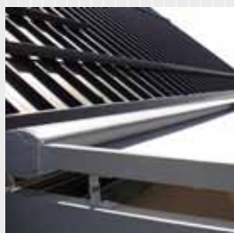
Gavel i aluminium.